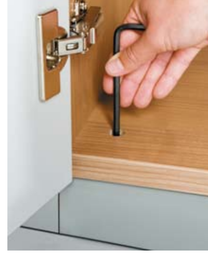
Sockeljustierung durch den Schrankboden