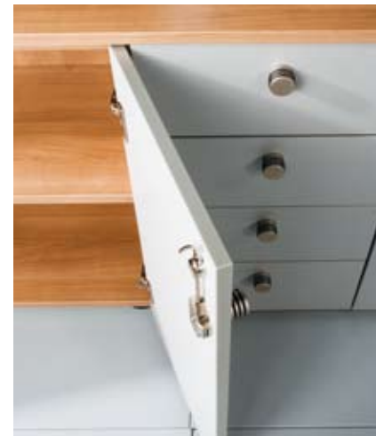
Scharniere mit 125 Grad Öffnungswinkel