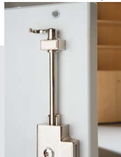
Schloss mit 3-Punkt-Verriegelung, Türanschlagdämpfer