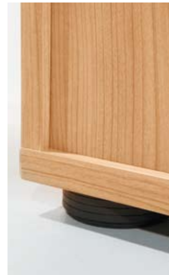
8 mm Sichrückwand, verleimt